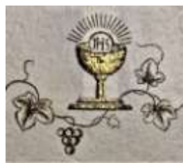
Výjev z blahopřání k primici

Avšak aby mohl být ustanoven farářem, musel ještě složit tři tzv. trienální zkoušky, což učinil vždy s ročním odstupem (25. 8. 1943, 22. 8. 1944, 27. 8. 1945). Nežli započal sloužit farníkům na pozici faráře, působil od 15. 8. 1942 – 31. 10. 1942 jako kooperátor ve farním kostele sv. Mikuláše ve Fryštáku u Holešova a od 1. 11. 1942 – 31. 8. 1945 ve stejné funkci ve farním kostele sv. Petra a Pavla v Penčicích u Přerova.