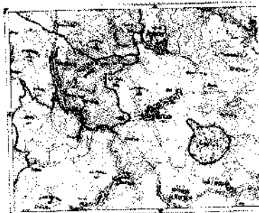
Letecká mapa úzání